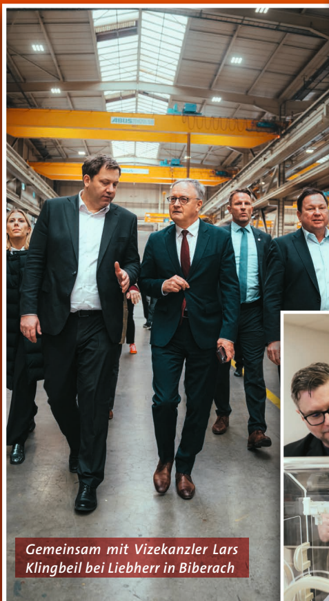
Gemeinsam mit Vizekanzler Lars Klingbeil bei Liebherr in Biberach