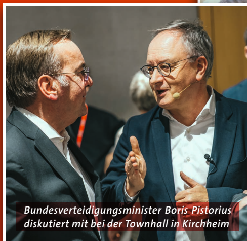
Bundesverteidigungsminister Boris Pistorius diskutiert mit bei der Townhall in Kirchheim