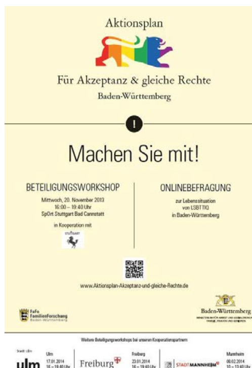
Abbildung 2: Plakat Beteiligungsworkshop

Insgesamt nahmen an den jeweils vierstündigen Beteiligungsworkshops über 600 Personen aus Landes- und Kommunalverwaltungen, Politik und der LSBTTIQ-Community, interessierten Bürger_innen sowie weitere gesellschaftliche Akteur_innen teil. Der Ablauf der Veranstaltungen verlief an allen Standorten analog. Zu Beginn gab es Impulsvorträge von Vertretungen der Landesregierung, dem jeweiligen Oberbürgermeister oder Bürgermeister und dem Netzwerk LSBTTIQ Baden-Württemberg sowie in Mannheim dem Rektor der