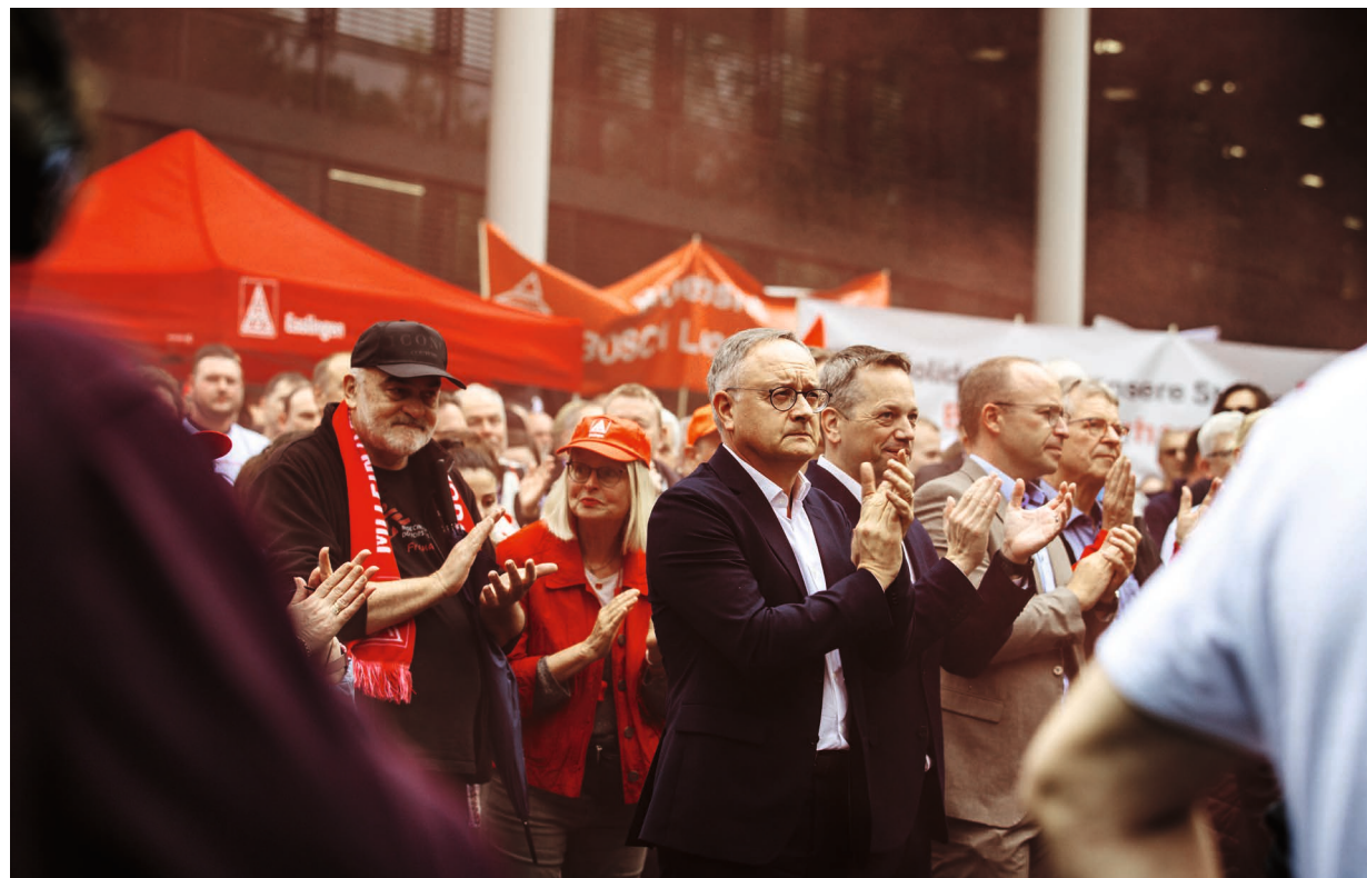
Wir von der SPD stehen an der Seite der Beschäftigten, wenn es um die Zukunft des Automobil-Standorts Baden-Württemberg geht.

Wenn das bisherige Verbrenner-Aus 2035 nicht leistbar ist – welcher Zeit-