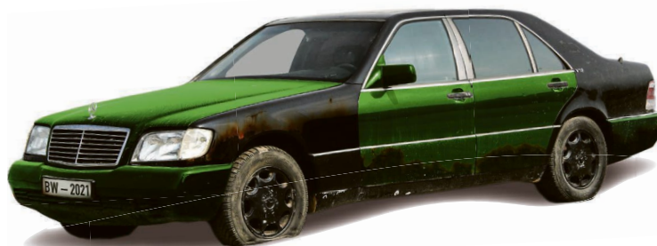
BADEN-WÜRTTEMBERG MUSS IN VIELEN BEREICHEN DRINGEND VORWÄRTS KOMMEN. GRÜN-SCHWARZ ZEIGT: MIT IHNEN IST DAS NICHT MÖGLICH.